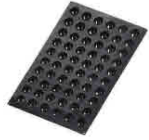
408 | Moldes BLACK Black moulds