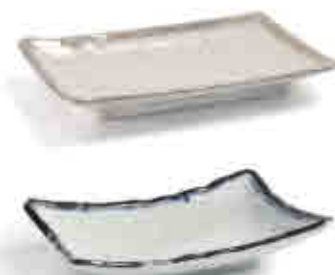
164 Melamina EARTH / SEA 166 Melamine