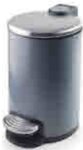
376 | Papeleras pedal Pedal bins