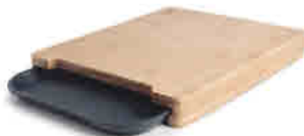
305 Tabla de corte COLLECT Cutting board