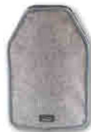
235 Fundas enfriabotellas Bottle cooler covers