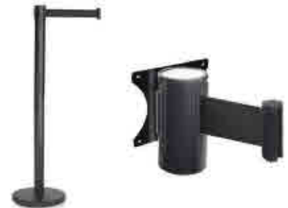
380 | Postes separadores BLACK Separator post