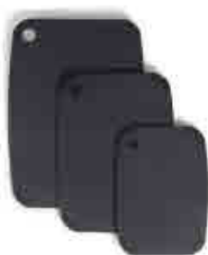
306 Tablas de corte Cutting boards