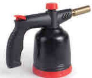
395 | Soplete gas Blow torch