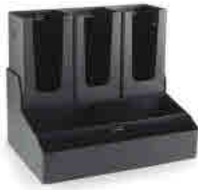
325 | Organizador Café Coffee organizer