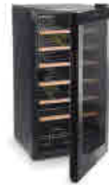
515 | Armario refrigerador Wine cooler