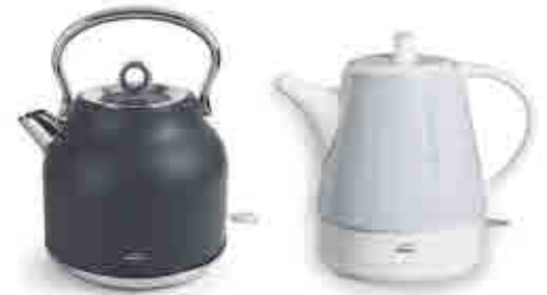
225-7 Hervidores de agua 476-8 Electric kettles