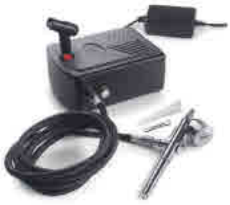
402 | Aerógrafo con compresor 467 | Airbrush w/compressor