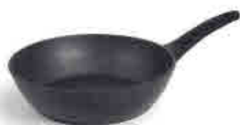
80 Colección JAVA JAVA Collection