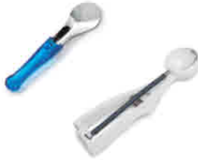
406 | Racionador helado Ice cream scoop