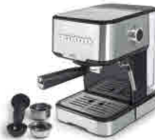
219 Cafetera espresso SENCE 481 Espresso coffee maker