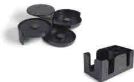
246 Accesorios cóctel Cocktail accessory