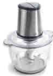
443 | Picadora de cristal Glass electric mincer