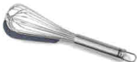
121 Batidor con espátula 387 Whisk with spatula