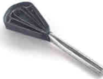
214 Desescamador pescado Fish scraper