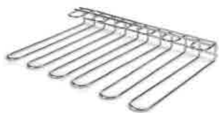
245 Soporte copas Cups stand