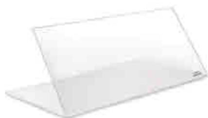
256 Vitrina Expositora Bar Bar Display Case