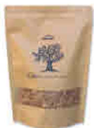
146 Serrín ahumador 600 g Wood chips, 600 g