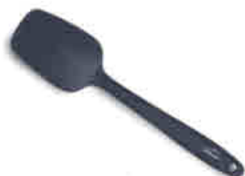
119 Utensilios silicona GREY 391 GREY silicon utensils