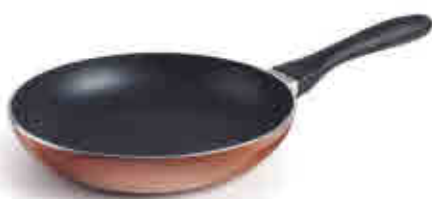
84 Sartén GARINOX GARINOX frying-pan