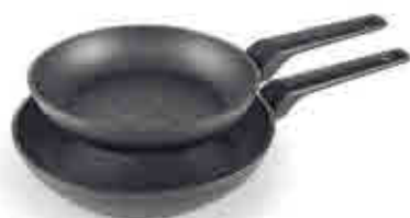
83 Set 2 sartenes FOGO FOGO 2 frying-pans set