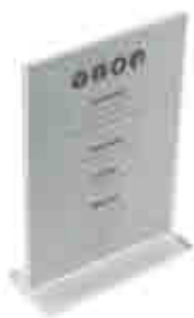
255 Porta menú sobremesa Menu cover