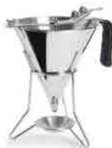
143 Dosificador INOX 397 Portionner