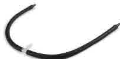
146 Manguera doble ahumador Double smoker accessory