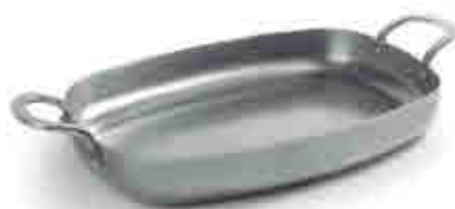
76 Plancha grill FERRUM FERRUM grill plat plaque