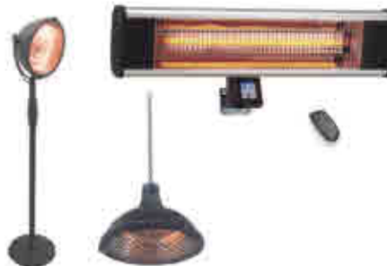
528 | Calentadores Electric heater