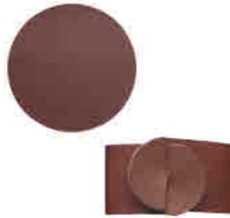
182 Posavasos / Servilleteros Coasters / Napkin rings