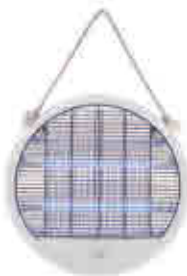
525 | Matamosquitos WHITE WHITE mosquito killer