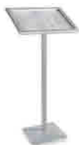
252 Atril Porta menú Menu holder lectern