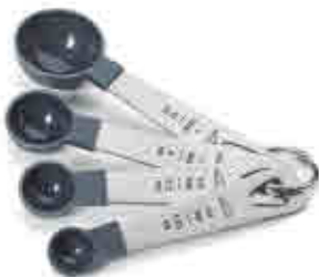
384 | Cucharas/cazos medidores Measuring cups