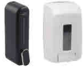
373 | Dispensadores de jabón/gel Soap and gel dispenser