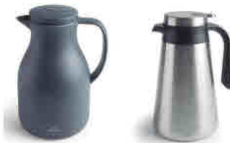
230 Jarras termo Vacuum flasks