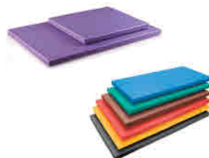
309 Tablas de corte Polietileno Polyethylene cutting board