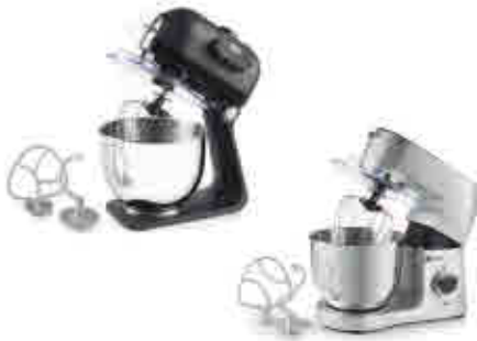
432 | Batidoras-amasadoras Mixer-kneader