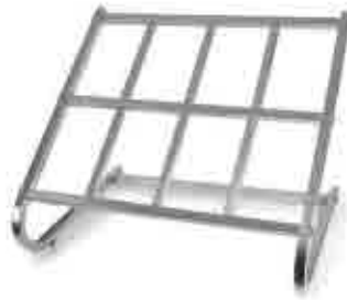
342 | Soporte para cubetas Cuvette support