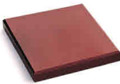
307 Tajo de corte carnicero Butcher Block