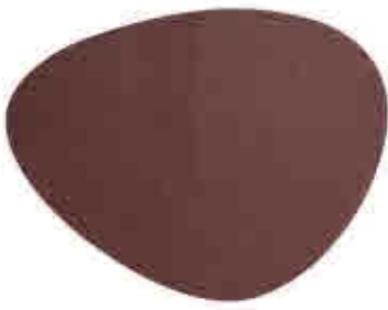
181 Manteles de mesa Tablecloths