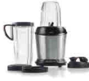
492 | Batidora personal PRO Individual blender