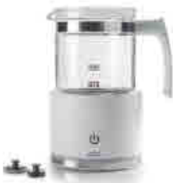
218 Espumador de leche 479 Milk frother