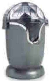
487 | Exprimidor automático Automatic juicer