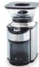
216 Molinillo eléctrico 480 Electric grinder