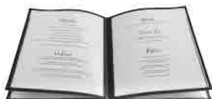
262 Porta menú PVC Menu cover