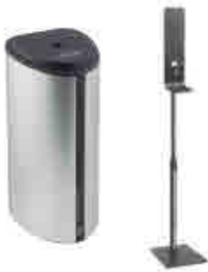
374 | Soporte dispensador Dispenser support