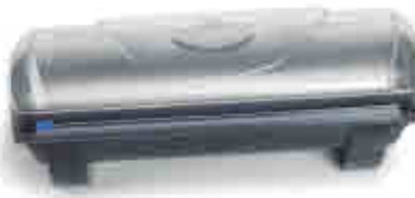
377 | Dispensador film Film dispenser