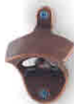
249 Abrebotellas pared Wall mounted bottle opener