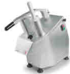
446 | Cortadora de vegetales Vegetables slicer