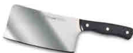
297 Machete Cleaver