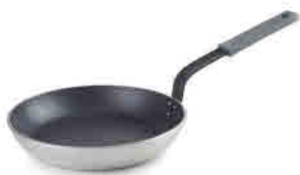
70 Sartén PREMIUM PREMIUM frying-pan