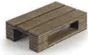
197 Mini palet presentación Mini pallet for presentation