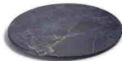
175 Colección STONE-Melamina STONE collection-Melamine